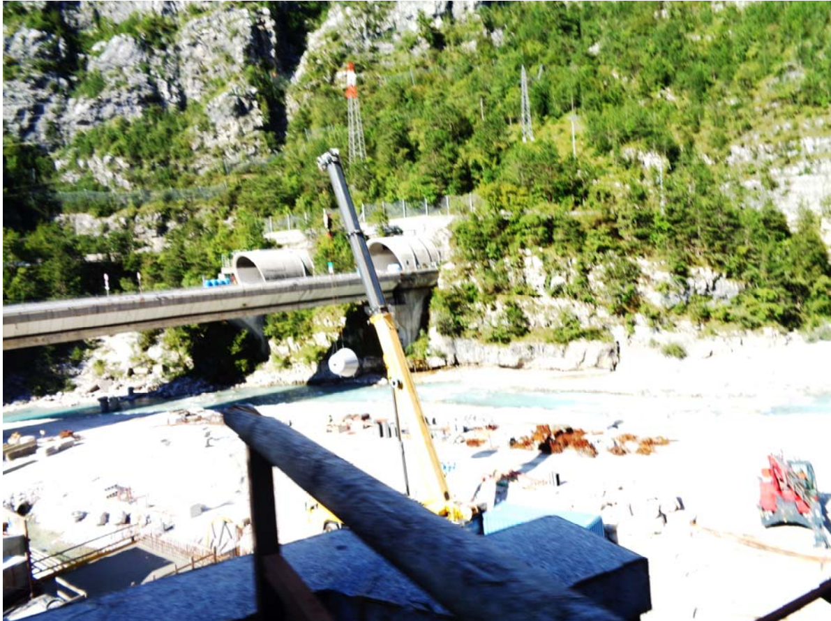
Baustelle am frei fließenden Fluss Fella zur Errichtung eines Damms mit Kleinkraftwerk 2022.