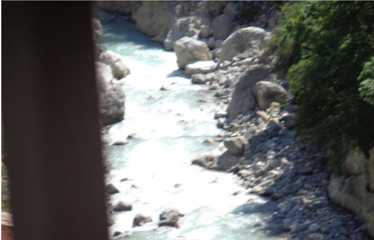
Der Fluss Fella frei fließend im Kanaltal - Val Canale di Ferro.