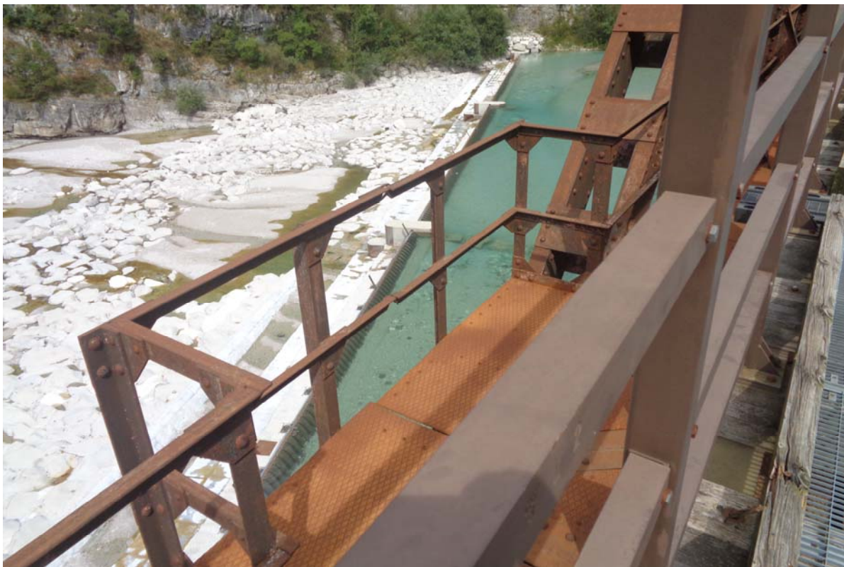
Fertig gestellter Damm 2024 am früher komplett frei fließenden Wildfluss der Fella zur Regulierung der Wassermenge und somit Zerstörung des Flussbettes, weil dadurch dem Fluss die selbst regulierende Bewegungsfreiheit genommen wurde.