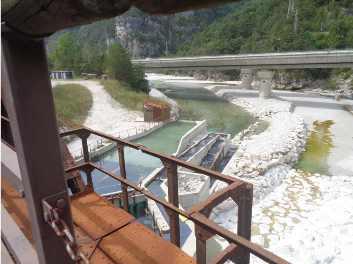
Fertig gestellter Damm 2024 am ehemals komplett frei fließenden Wildfluss der Fella mit Schleuse und Fischtreppe zur Regulierung der Wassermenge und somit Zerstörung des Flussbettes, weil dadurch dem Fluss die selbst regulierende Bewegungsfreiheit genommen wurde.