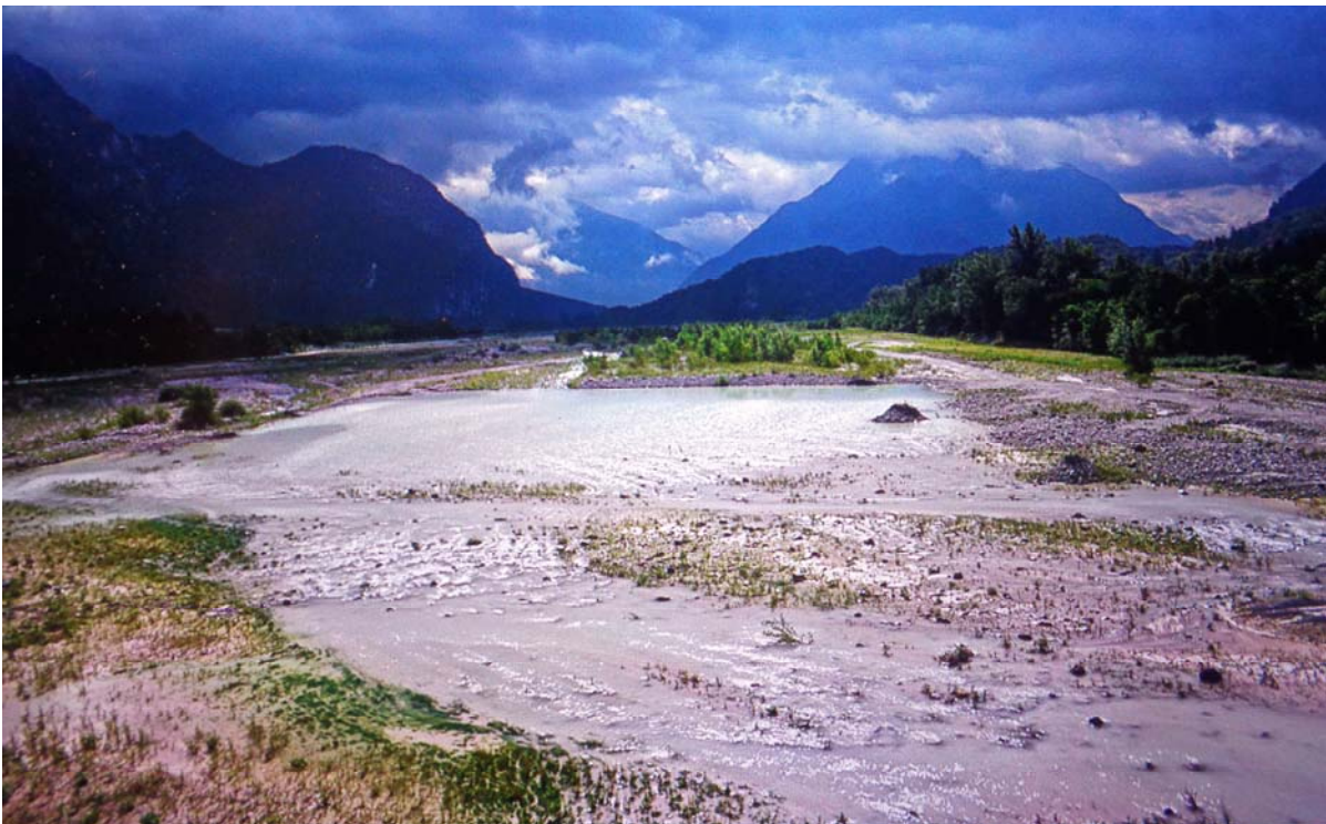
Der letzte völlig frei fließende Wildfluss der Alpen, der Tagliamento, in der Nähe von Tolmezzo, bevor die Fella in den Tagliamento mündet.